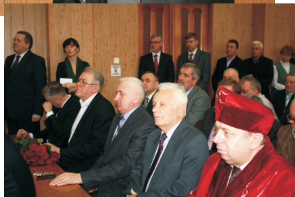
ФОТОРЕПОРТАЖ З ПОДІЇ - ст.14