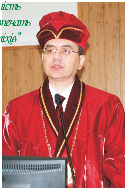
На фото - новообраний ректор ТДМУ імені І.Я. Горбачевського, професор Михайло Корда

Так сказав 27 лютого 2015 року під час урочистостей з нагоди призначення у своїй промові ректор ТДМУ, професор Михайло Корда.