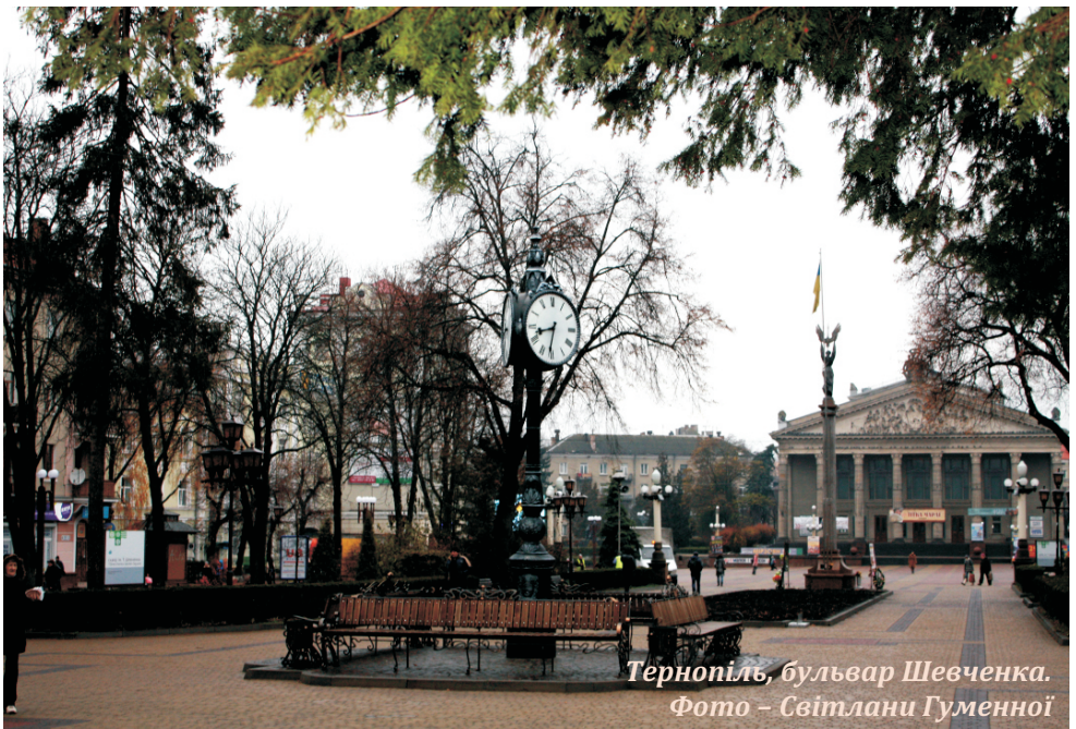
Тернопіль, бульвар Шевченка.

17 листопада - Всесвітній день боротьби проти ХОЗЛ ;