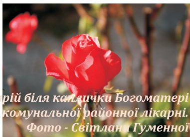
Смт. Товсте. Розарій біля каплички Богоматері на території Товстевської комунальної районної лікарні.